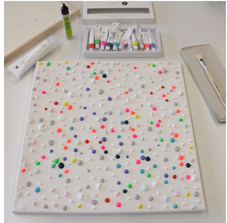
2. Dazwischen die Art Acrylic Farben aus dem Set punktuell verteilen.

Diese und auch viele weitere Anleitungen finden Sie online unter: www.rico-design.com/anleitungen