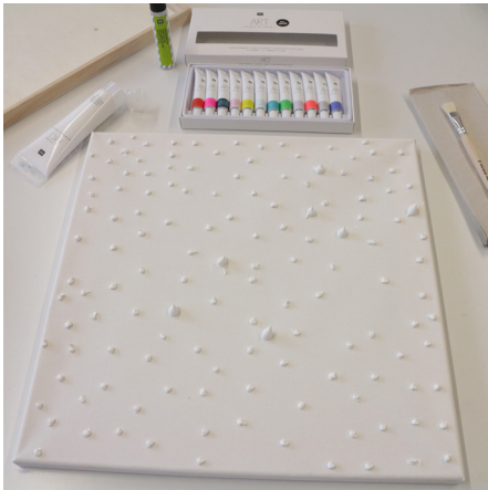
1. Die Art Acrylic Farbe Weiß in vielen Tupfen über den Keilrahmen verteilt auftragen.

ART Acrylicfarbe weiss Borstenpinsel Keilrahmen Objektrahmen Bastelkleber ART Acrylic Set Fashion