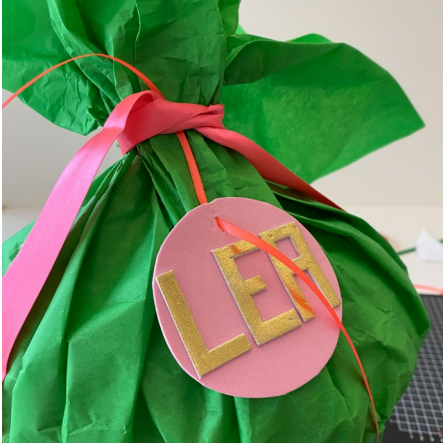
9. Mithilfe der Druckvorlagen „Namensschild“ und „Alphabet“ den Anhänger basteln und diesen mit dem dünnen Satinband an der Schultüte befestigen.