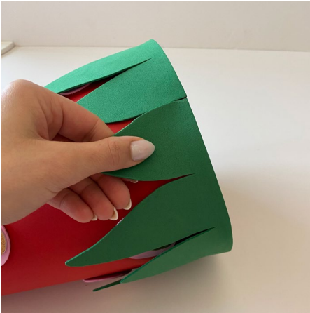
7. Die Zacken des Erdbeergrüns leicht nach außen biegen.