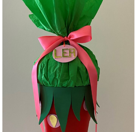
10. Die Tüte mit dem breiten Satinband verschließen und eine Schleife binden – fertig ist die Erdbeer-Schultüte!

Diese und auch viele weitere Anleitungen finden Sie online unter: www.rico-design.com/anleitungen