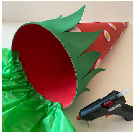
8. Grünes Seidenpapier an der Innenseite der Tüte „wellenartig“ festkleben.