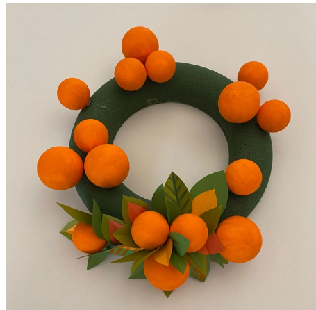
6. Die fertigen Blätter und bemalten Kugeln mit Rico Heißkleber auf dem Kranz fixieren. In der oberen Mitte des Kranzes einen Freiraum für die Schleife lassen.