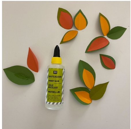
4. Mit Bastelkleber verschiedenfarbige Blätter aufeinander kleben. Dabei ist das untere Blatt immer etwas größer als das aufgeklebte Blatt.