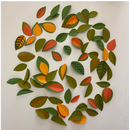
5. Wenn genügend Blätter zusammengeklebt sind, mit Acryl-Farben zarte Adern auf ein einige der Blätter malen.